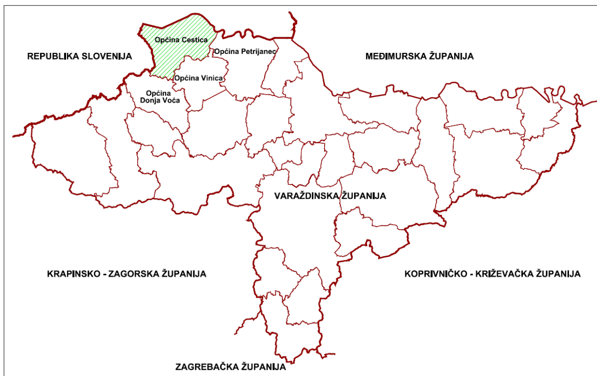
Prikaz 1 Smještaj Općine Cestica unutar Varaždinske županije

Unutar Varaždinske županije Općina Cestica graniči s općinama Petrijanec, Vinica i Donja Voća.